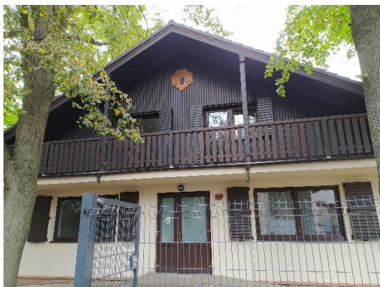
Nová vlastní klubovna